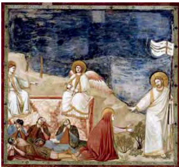
Zmartwychwstanie - fresk autorstwa Giotto di Bondone namalowany ok. 1305 roku dla Kaplicy Scrovegnich w Padwie.

Niech nadchodzące Święta Zmartwychwstania Pańskiego