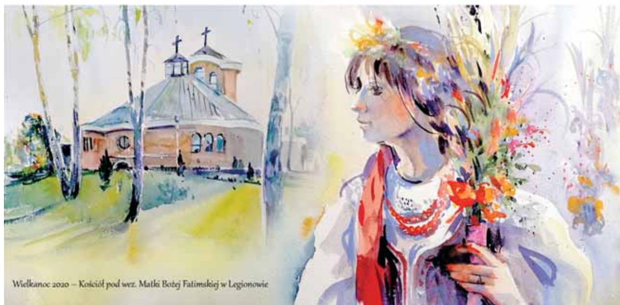
Wielkanoc 2020 - Kościół pod wez. Matki Bożej Fatimskiej w Legionowie