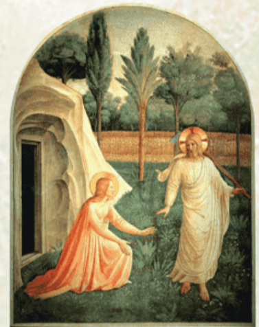
Fra Angelico, "Noli me tangere", około 1450 r.