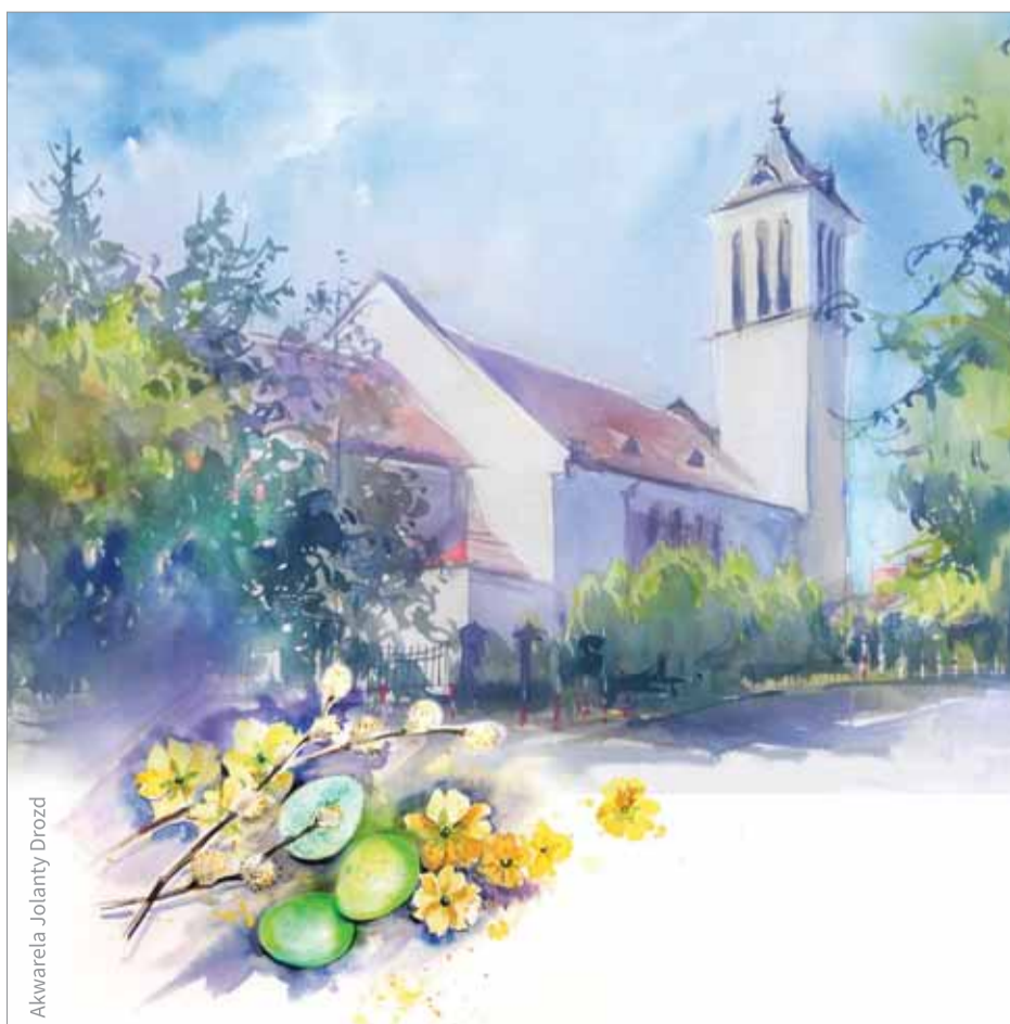
Akwarela Jolanty Drozd